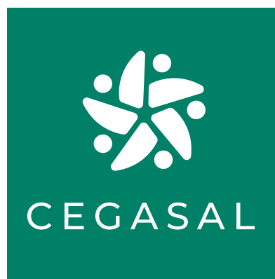
SOBRE PANTONE 3288 C