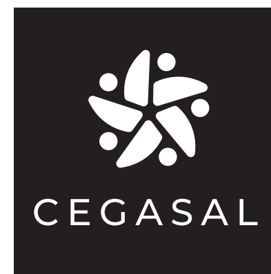
BLANCO SOBRE NEGRO