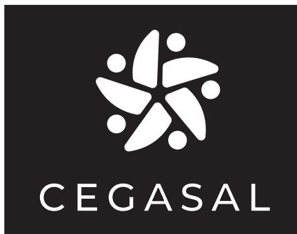
Versión en positivo