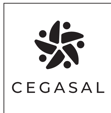
NEGRO SOBRE BLANCO